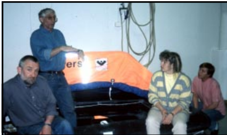
Fra et tidligere kurs i båtførerprøven.