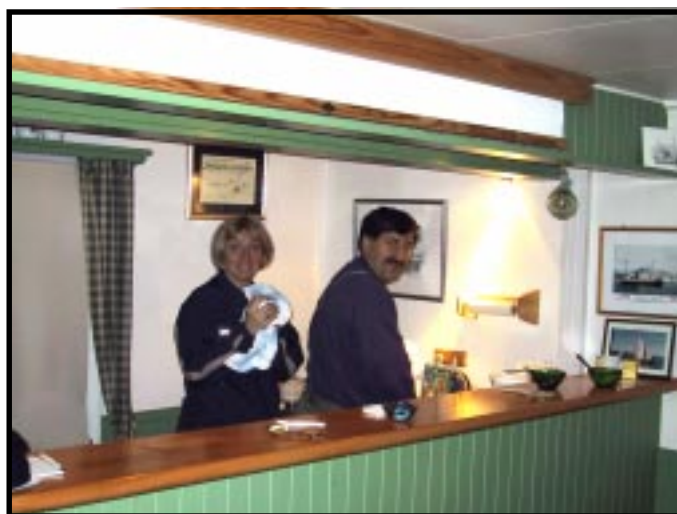
Ekteparet Rødsand bak disken i Molokroken

Moloen er blitt den nye "Promenadegata" i byen også på vinterstid. Dette må vi utnytte på best mulig måte for Molokroken og kystlaget.